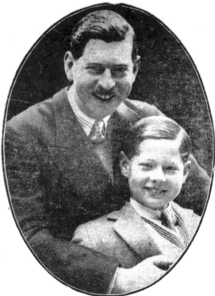
M. S. Regele Carol al II-lea și M. S. Mihai Mare Voevod de Alba Iulia